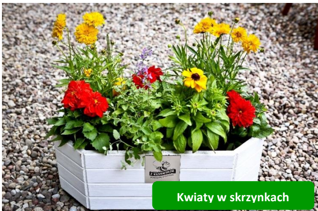
Kwiaty w skrzynkach