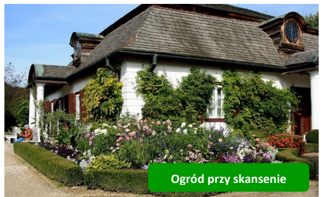
Ogród przy skansenie