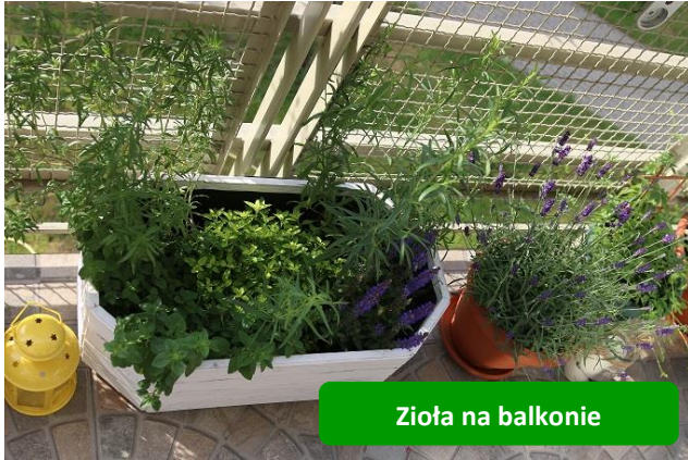
Zioła na balkonie