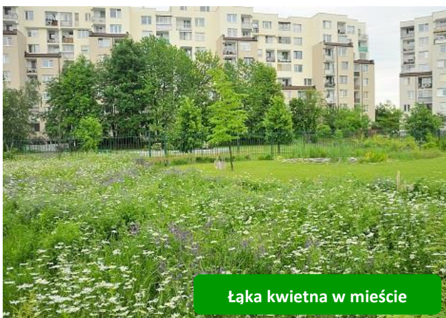
Łąka kwietna w mieście