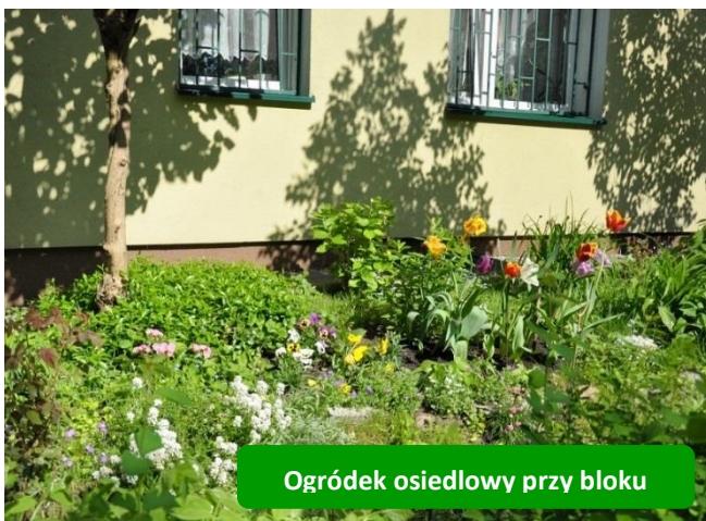
Ogródek osiedlowy przy bloku