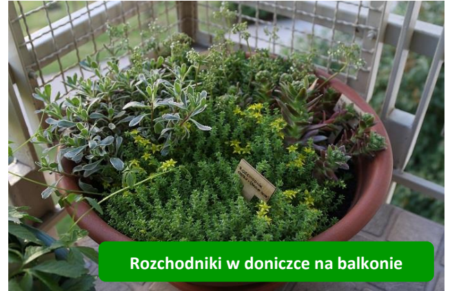
Rozchodniki w donicze na balkonie